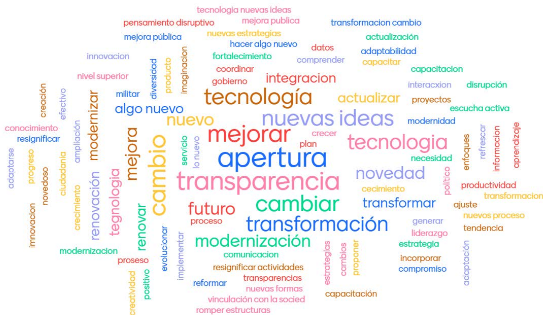
Figura 1. Significado de innovación política según trabajadores y trabajadoras de la Legislatura de Córdoba

Los trabajadores y trabajadoras reflexionaron sobre el papel que desarrollan así como también sobre las tareas y procesos que podrían modificarse para profundizar el proceso de apertura y vinculación con la comunidad.